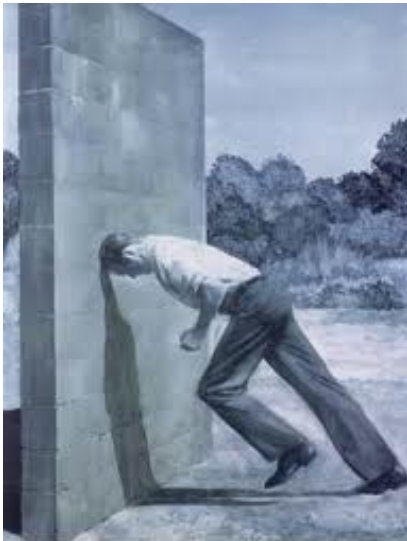
A SHORT HISTORY OF MODERNIST PAINTING (DETAIL) MARK TANSEY